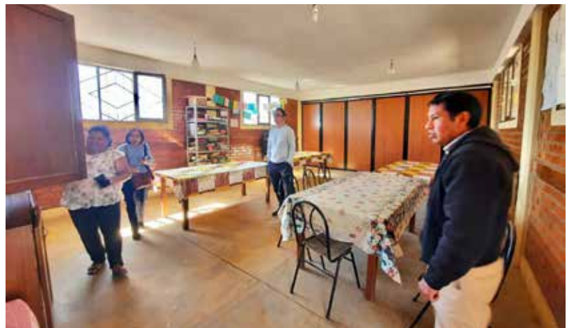
Cuisine et réfectoire en cours d'aménagement