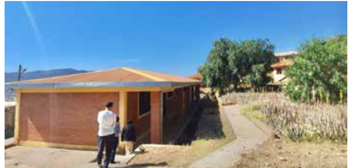
Le nouveau lieu d'accueil des enfants