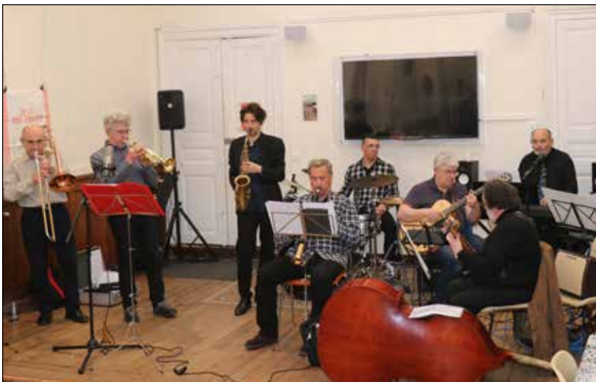
Le groupe Jazz